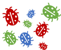
Conjuntos de objetos contáveis