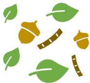
Elementos de la naturaleza

Cualquier colección de elementos que se pueda clasificar en pilas de Sí y No según un atributo específico (tipo, tamaño, forma, color, textura, etc.) en particular. Algunos ejemplos incluyen: