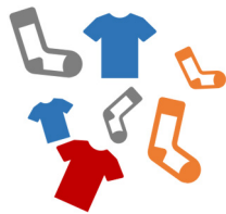
Prendas de vestir