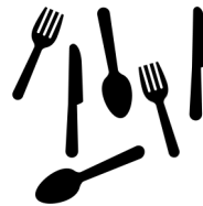
Artículos de cocina